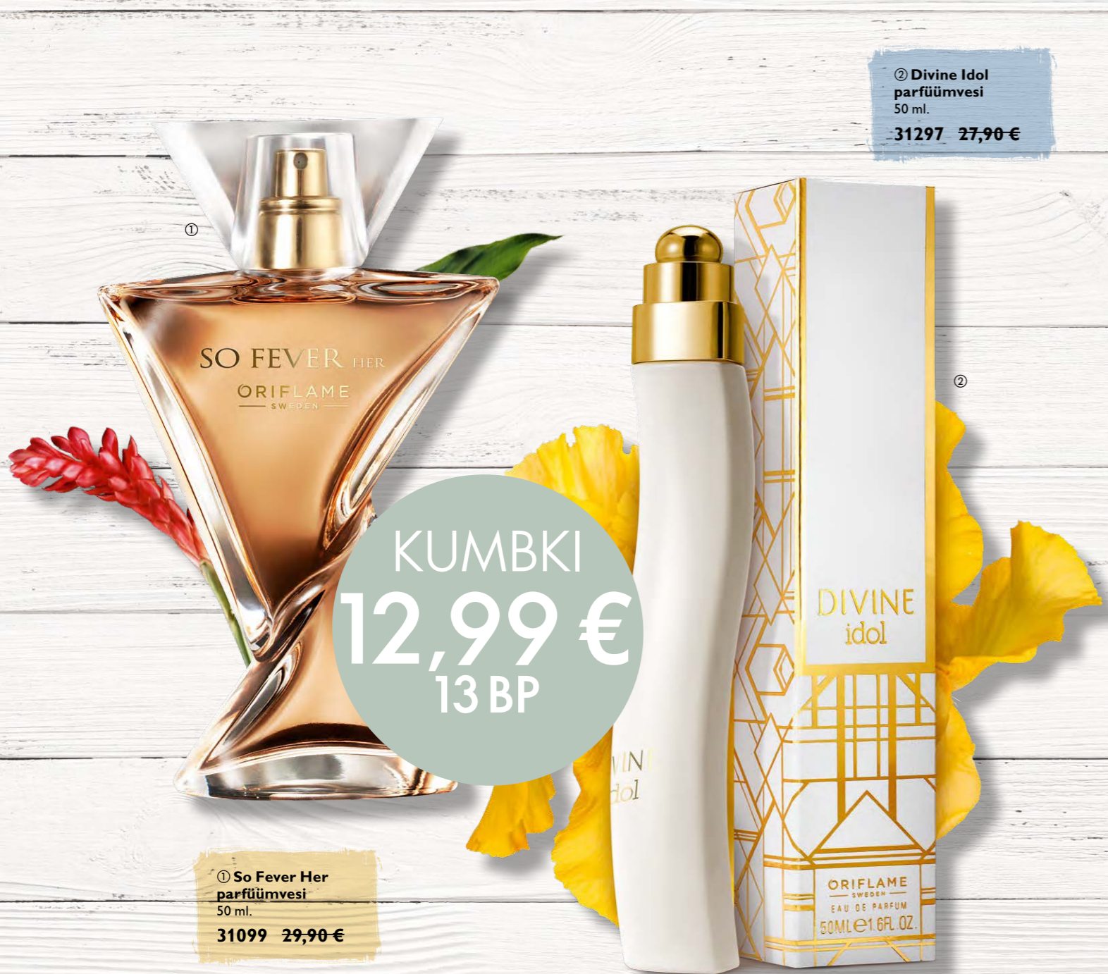
① So Fever Her parfüümvesi 50 ml. 31099 29,90 €