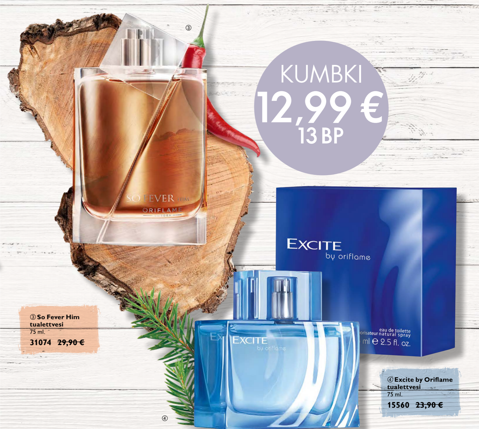
③ So Fever Him tualettvesi 75 ml. 31074 29,90 €